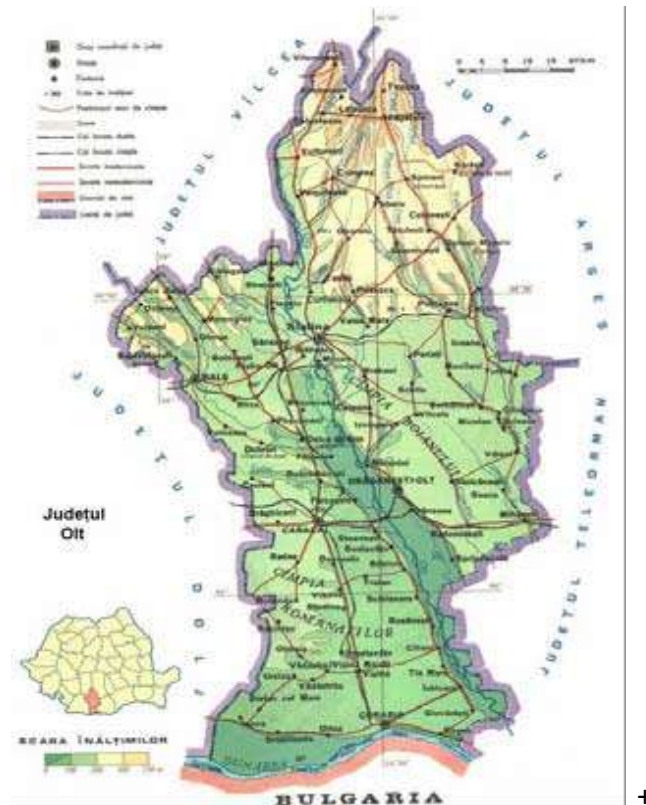
Figura 1: POZITIA GEOGRAFICA A PROIECTULUI

Județul Olt se afla situat în Regiunea de dezvoltare 4 Sud-Vest Oltenia și are o populație de 469.637 locuitori (anul 2011). Din punct de vedere administrativ, județul Olt este compus din 2 municipii (Slatina și Caracal), 6 orașe (Bals, Corabia, Drăganesti Olt, Piatra Olt, Potcoava și Scornicești) și 104 comune.